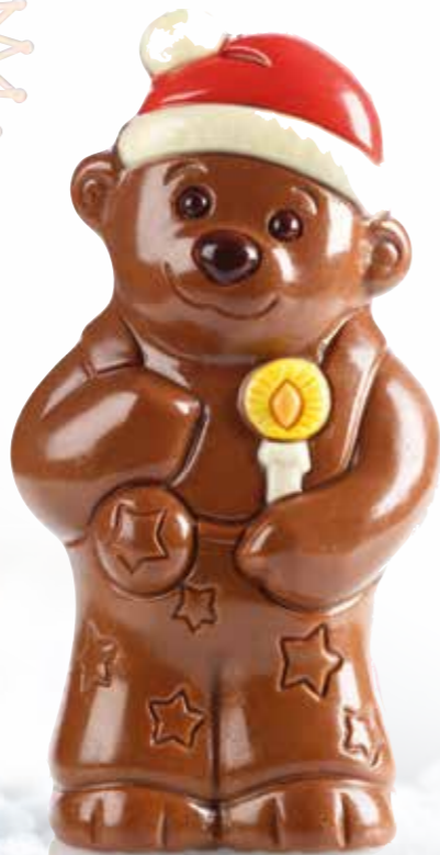
Nounours - 130 g Moulage chocolat au lait. H 16,5 cm.