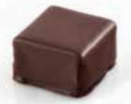
Vanilla Ganache amère à la vanille Bourbon Enrobage chocolat noir