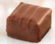
Granité Gianduja pur noisettes parsemé d'éclats de noisettes torréfiées Enrobage chocolat au lait