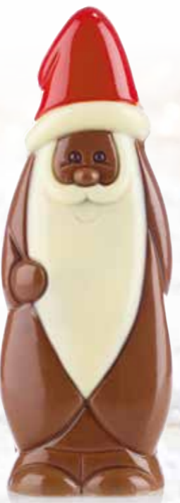
Vive les jouets - 150 g Moulage chocolat au lait avec édulcorant. H 21,5 cm.