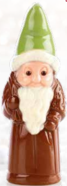
Lutin - 50 g Moulage chocolat au lait. H 13,5 cm.