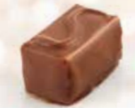
Pralino Praliné amandes et noisettes Enrobage chocolat au lait