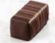
Authentique Ganache mi-amère nature Enrobage chocolat noir