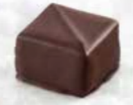
Peru Ganache Pérou Enrobage chocolat noir