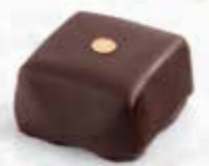
Carré Or Ganache mi-amère au café Enrobage chocolat noir