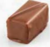
Noisetto Gianduja pur noisettes Enrobage chocolat au lait