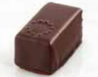
Zenith Ganache à la pulpe de framboise Enrobage chocolat noir