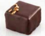
Los Angeles Praliné amandes aux éclats de grué de cacao Enrobage chocolat noir