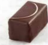
Reine Ganache mi-amère au miel Enrobage chocolat noir