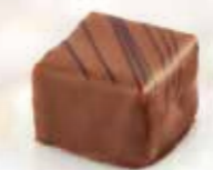
Grania Praliné amandes et noisettes parsemé d'éclats de noisettes torréfiées Enrobage chocolat au lait