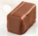
Café Gianduja pur noisettes au café Enrobage chocolat au lait