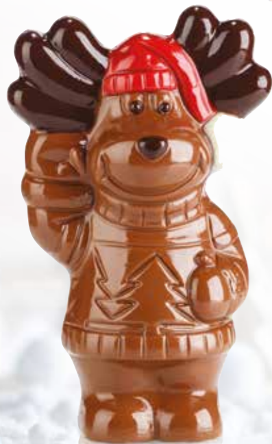
Alces l'élan - 100 g Moulage chocolat au lait. H 13,5 cm.