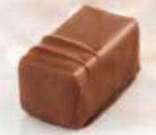
Caracas Ganache Vénézuéla Enrobage chocolat au lait