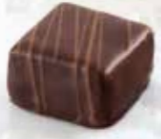
Caramande Pâte d'amande au caramel Enrobage chocolat noir

Selon le modèle de ballotins et boîtages, vous retrouverez tour à tour, en partie ou intégralement, les 15 variétés présentées.