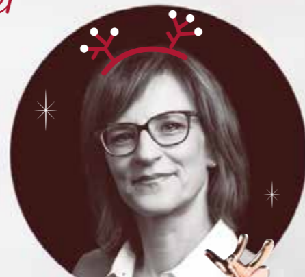
Martine à la chocolaterie

J' adore l'esprit de famille, les traditions alsaciennes et l'authenticité des repas de fêtes. Proposer les meilleurs chocolats au plus grand nombre, dans le respect de ce que mon père a créé, voilà ma philosophie.