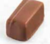
Mexico Ganache mi-amère au citron vert et à la tequila Enrobage chocolat au lait