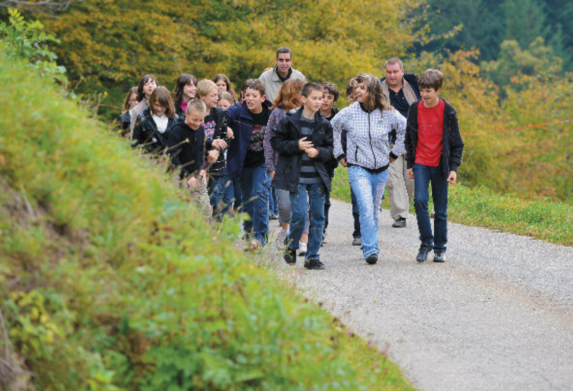
▲ Visite de la ferme auberge des Buissonnets