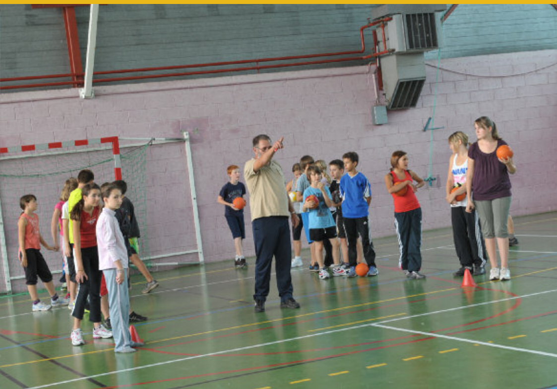
Un cours d'EPS (handball) ▼