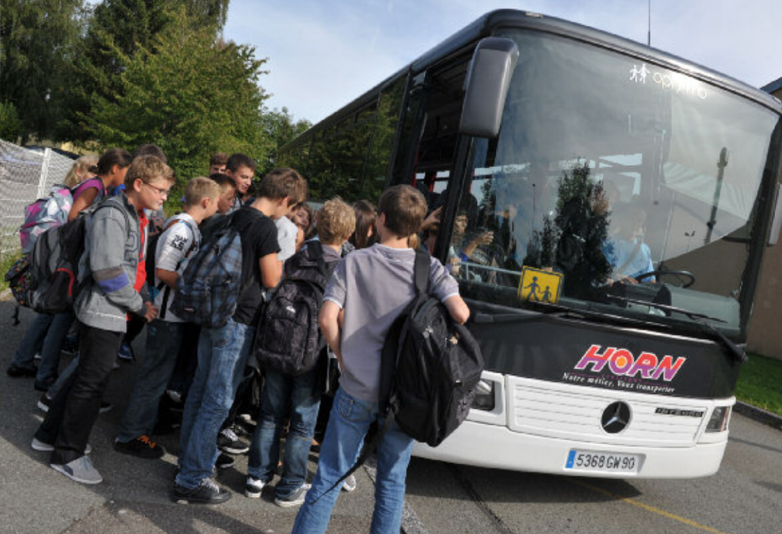
▲▼ Les transports scolaires