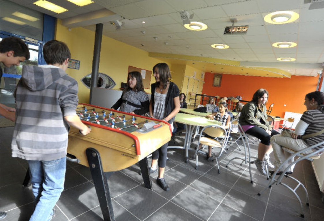
▲ Le foyer des élèves