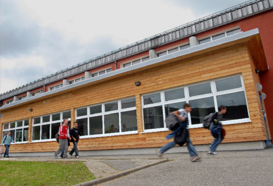
▲ Le préau