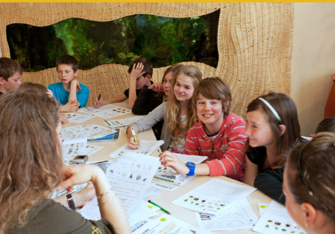
Un séjour d'intégration au Malsaucy ▼