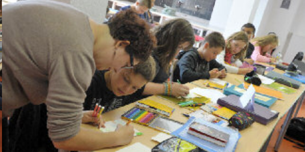
La salle d'arts plastiques rénovée

Le Centre de Connaissances et de Culture (ex CDI) est également un lieu privilégié d'aide, de découverte de ressources nombreuses avec des outils numériques de plus en plus nombreux.