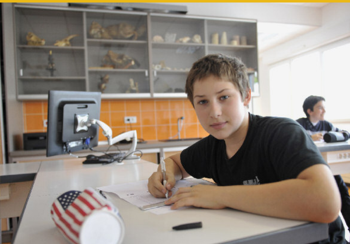
Une salle de science ▼