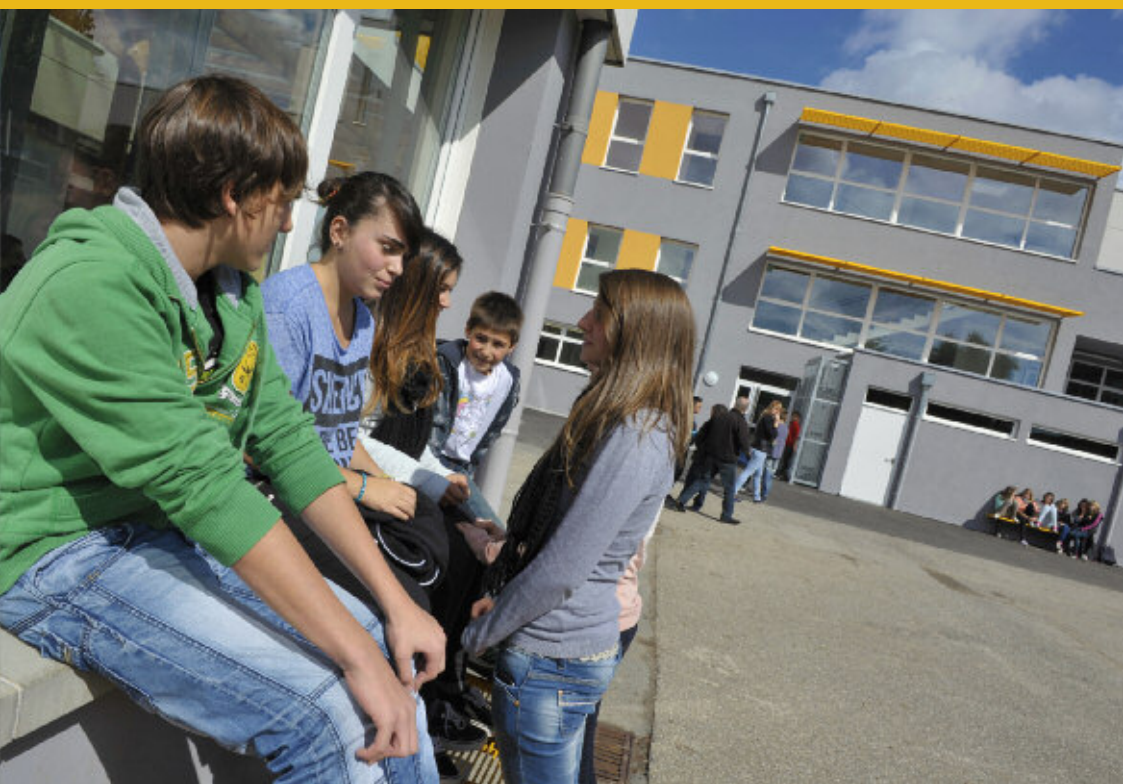
La cour ▼