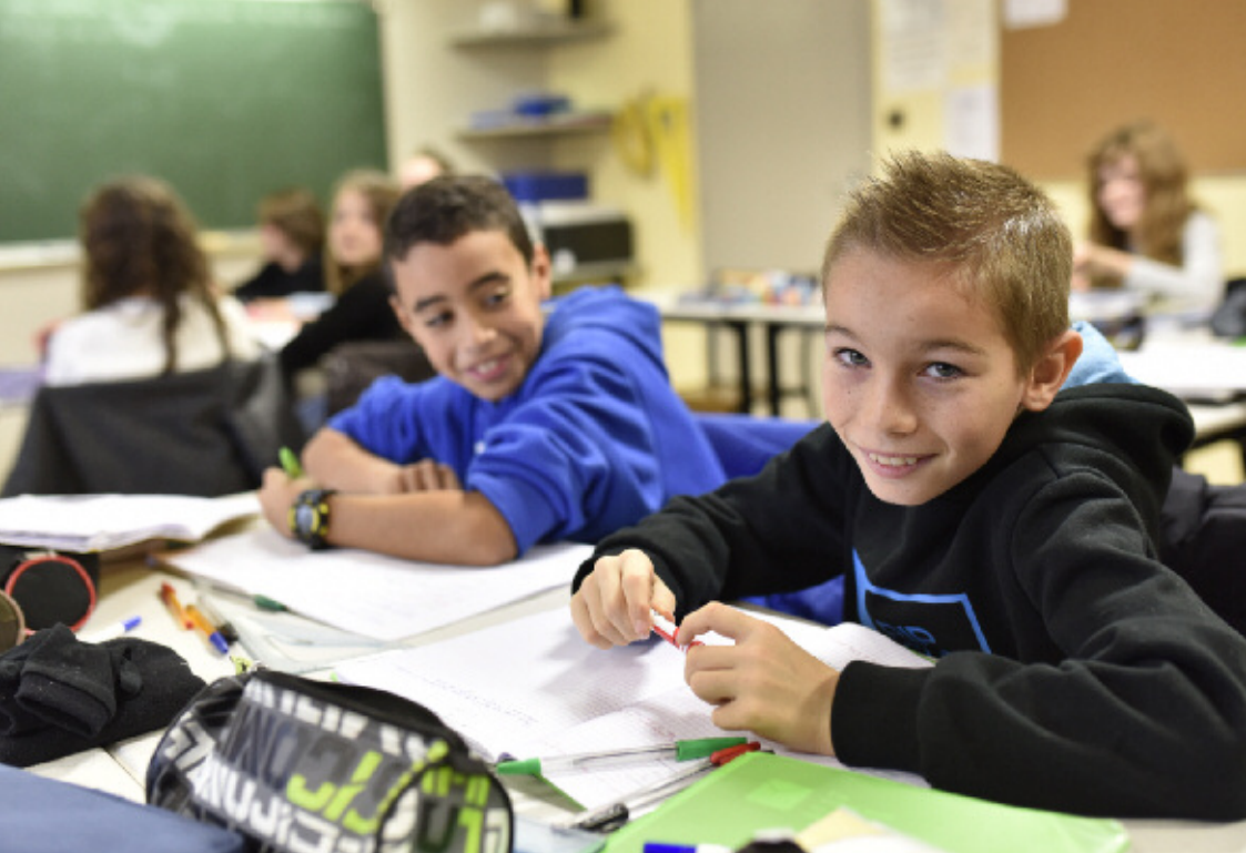
▲▼ Une salle banalisée