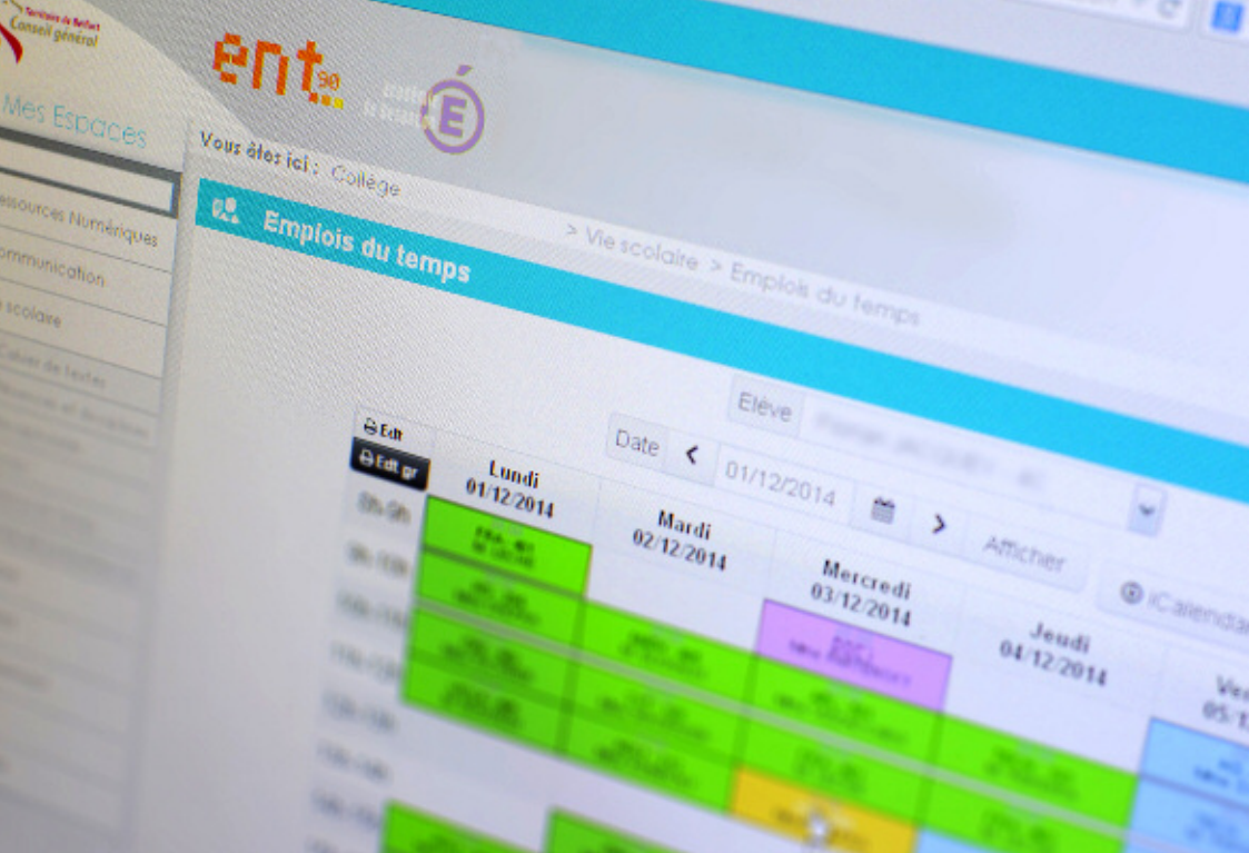
▲▼ L'interface utilisateur de l'ENT