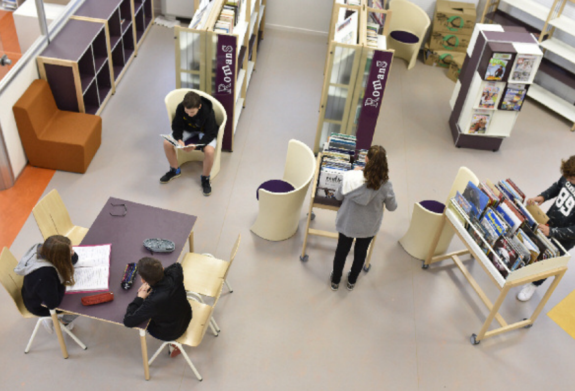
▲ Le CDI rénové