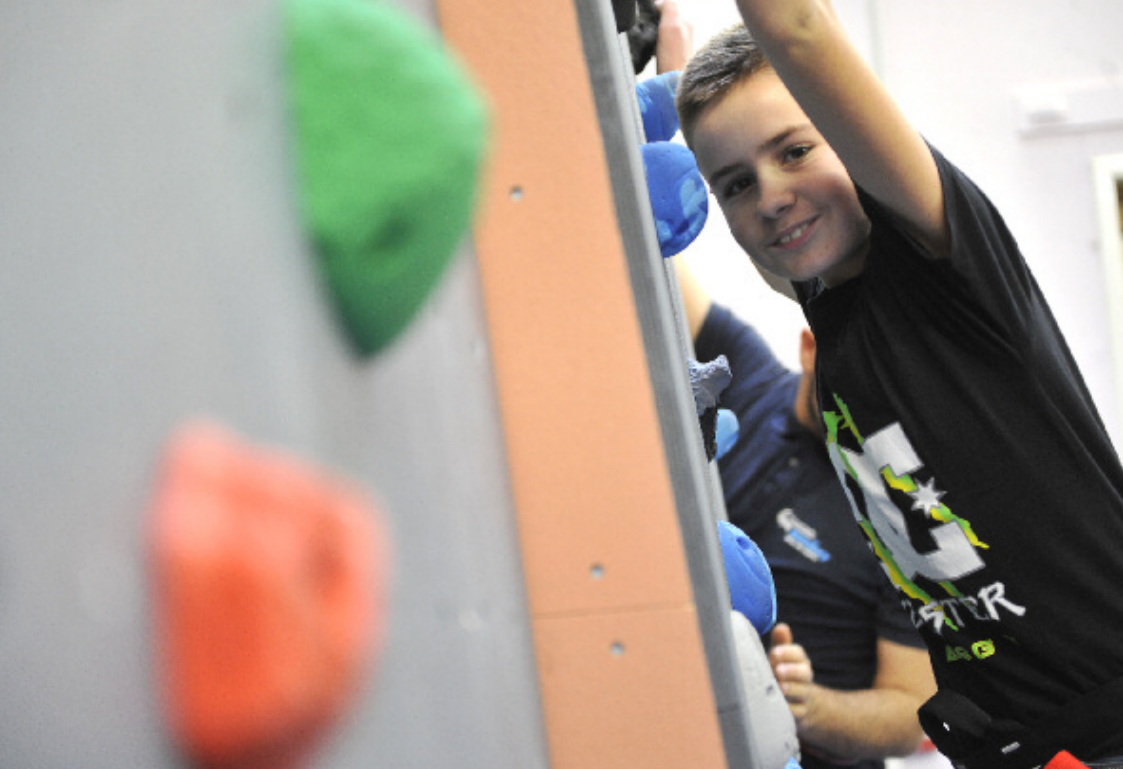
▲▼ Séjour d'intégration et activités sportives au Malsaucy