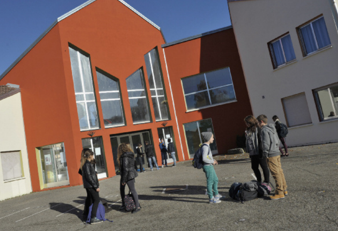
▲▼ La cour et l'entrée de l'établissement