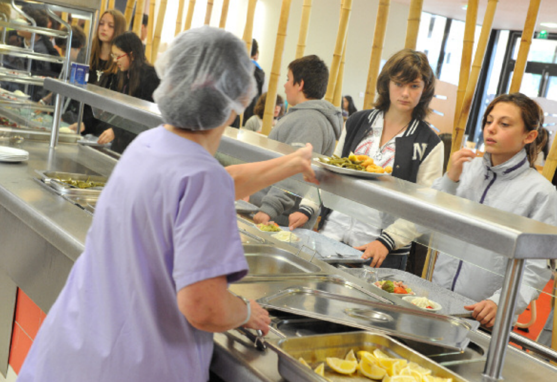
▲▼ La demi-pension