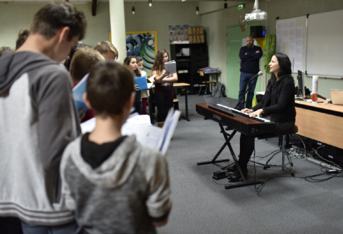
▲ Un cours de musique