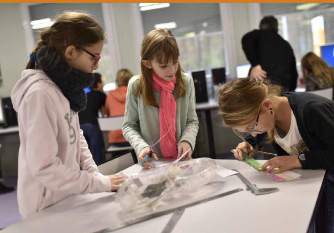
Un cours de technologie ▼