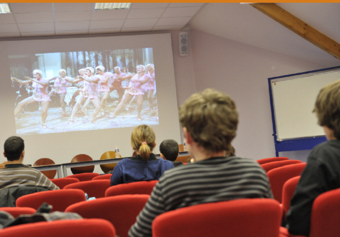
La salle audiovisuelle ▼