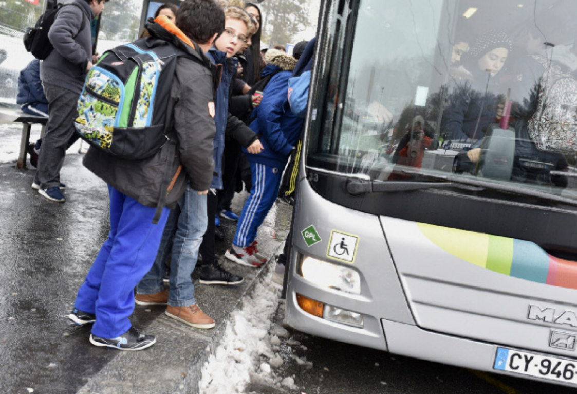
▲▼ Les transports scolaires